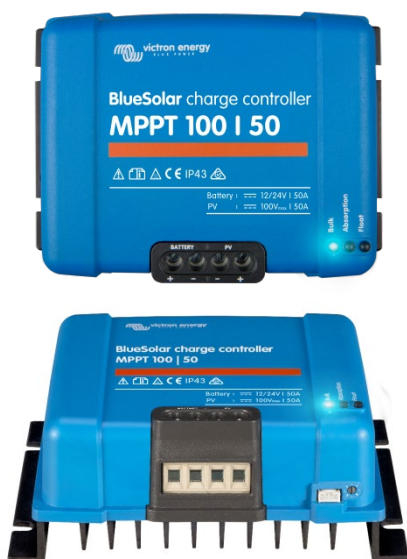
Solar Lade-Regler MPPT 100/50